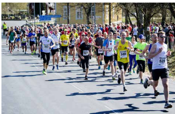
Folkfest, löpfest och rekordmånga deltagare när Hallarydsloppet firade 30 år i lördags.